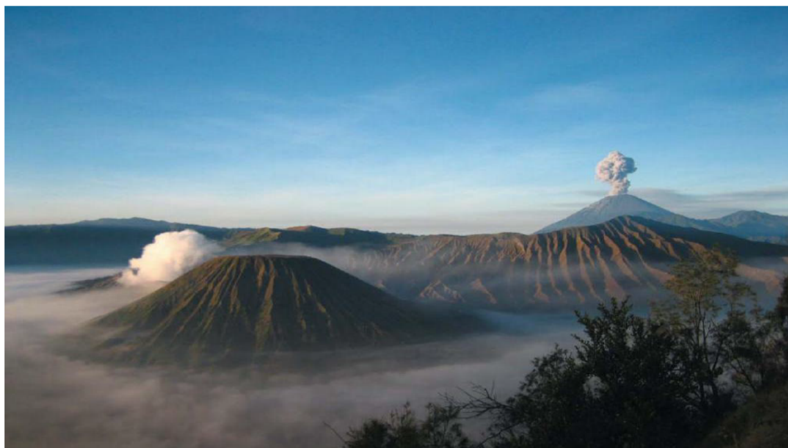
印尼著名的活火山—BROMO火山

印度尼西亚（以下简称印尼）位于亚洲东南部，由太平洋和印度洋之间的17508个大小岛屿组成，是世界上最大的岛国、最大的群岛国家，国土面积191.4万平方公里，海洋面积316.6万平方公里（不包括专属经济区）。包括苏门答腊岛、爪哇岛、苏拉威西岛以及婆罗洲和新几内亚的部分地区。与巴布亚新几内亚、东帝汶、马来西亚接壤，与泰国、新加坡、菲律宾、澳大利亚等国隔海相望。