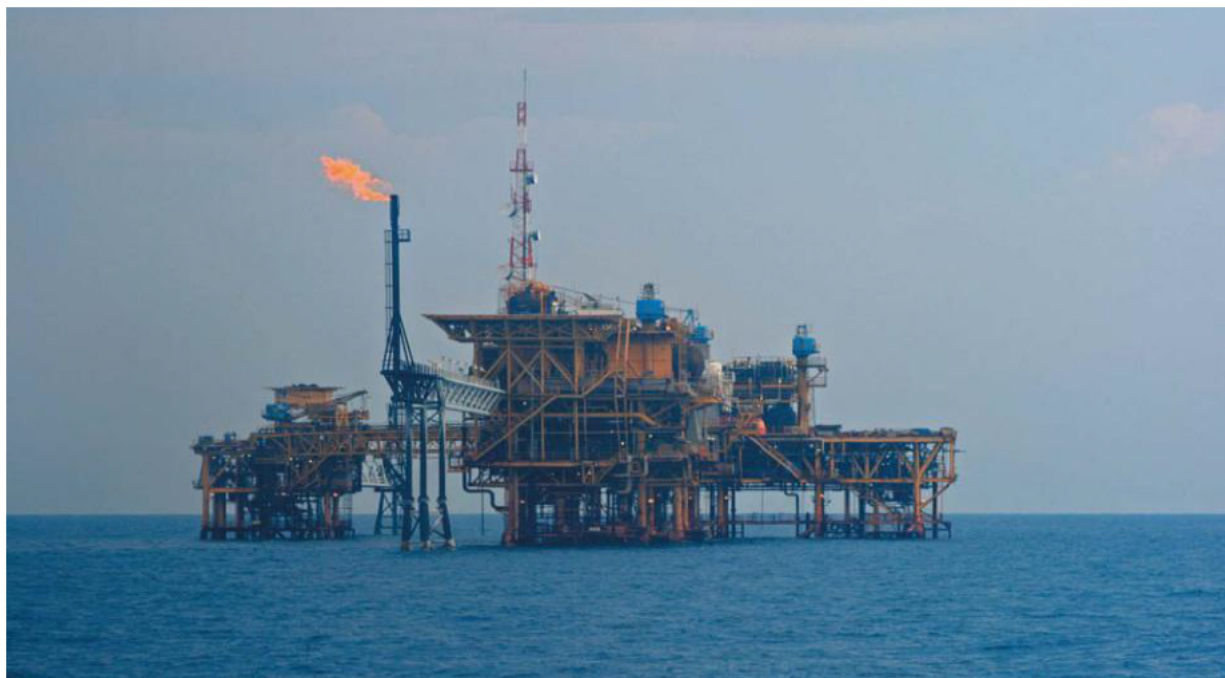
中海油在印尼的作业平台