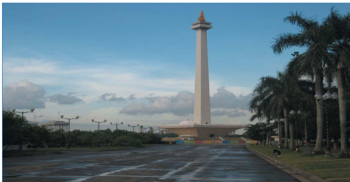
印尼独立纪念碑广场

印尼实行总统制，总统既是国家元首，也是政府首脑，同时掌管三军。总统、副总统均由全民直选产生，任期5年，总统可连任一次。现任总统为佐科·维多多，副总统为马鲁夫·阿敏，本届内阁于2019年10月组建，任期至2024年。