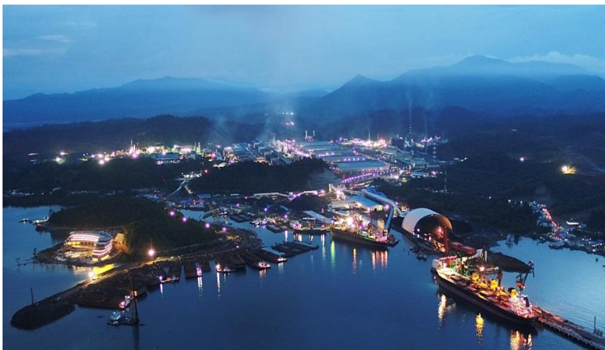
中国企业在印尼投资的青山工业园