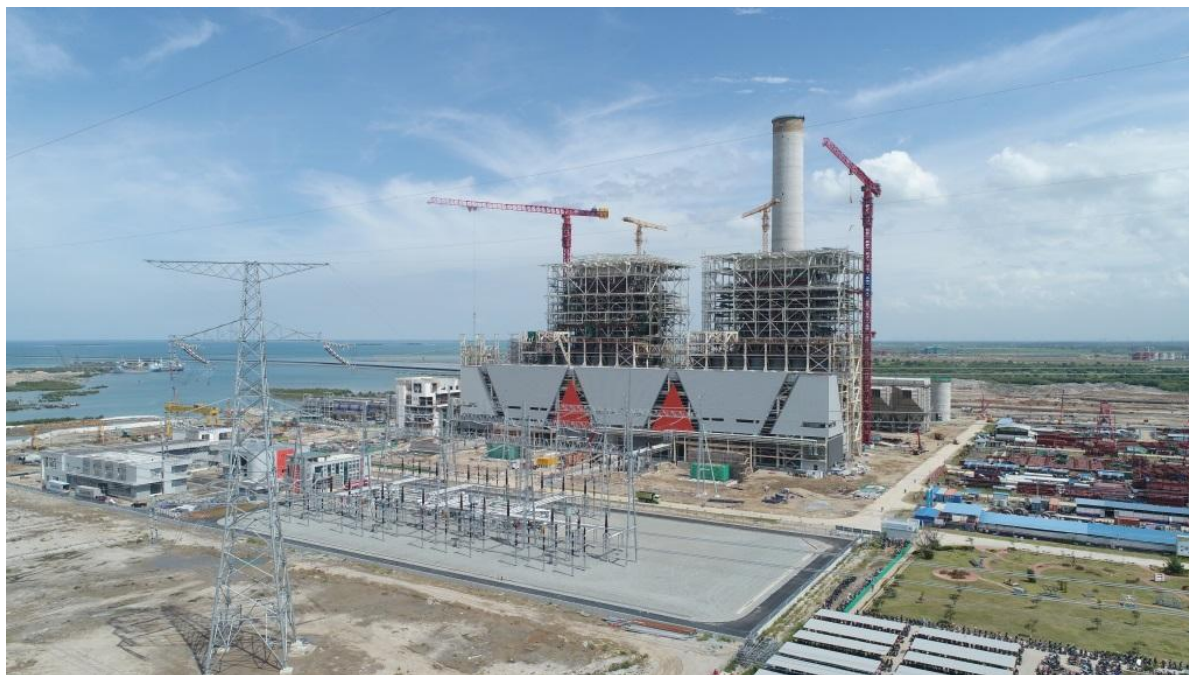
华国华印尼爪哇7号项目